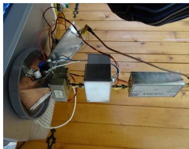
Le TX 10 GHz en gros plan