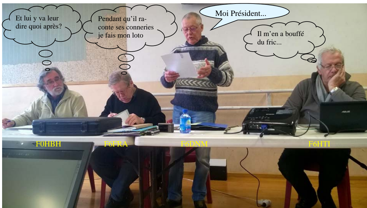
Le bureau devant l'assemblée générale présente les bilans....