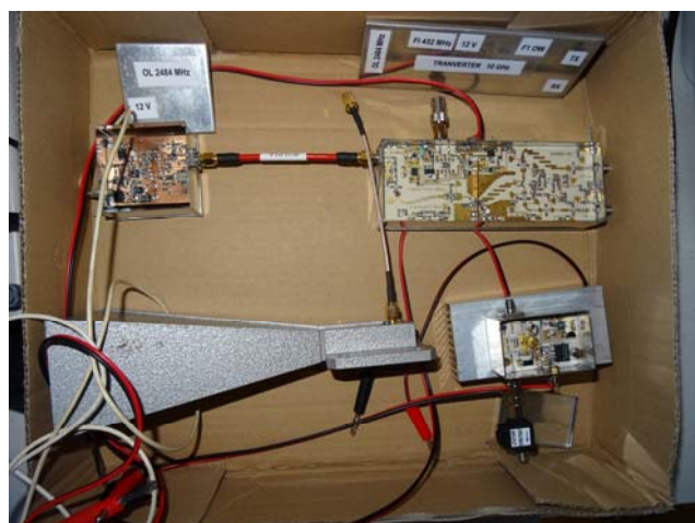
Le transverter 10 GHz avec son antenne cornet (F1OW)