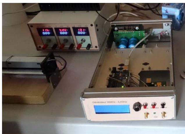
Le générateur 35 à 4,4 GHz de F1CIJ A gauche de l'image, on aperçoit une partie de la machine à plastifier qui servira à transférer des dessins sur papier « PNP - Blue » sur du cuivre