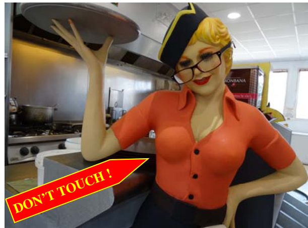
Là, c'était à midi, la serveuse virtuelle du Bistrot du Marché... Etonnant, non ?