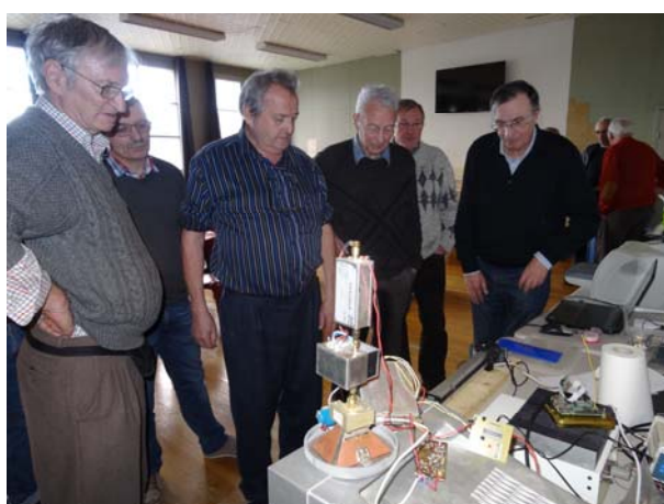
Présentation de quelques réalisations, au premier plan le TX 10 GHz de F1OW, et réalisation d'un CI sur papier « bleu » De G. à Dte.: F8DHU F1SHV F1CIJ F5PKB F5PKO F1BFZ