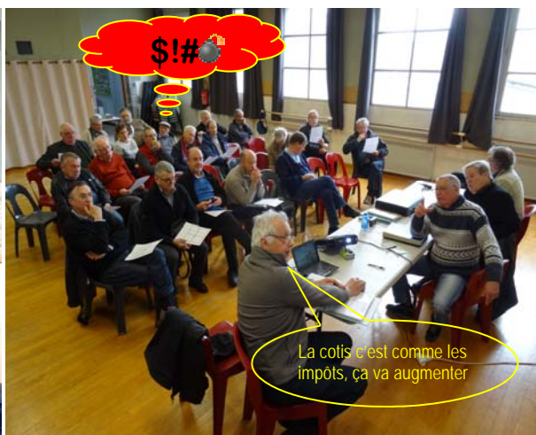
Le Trésorier présente le bilan financier