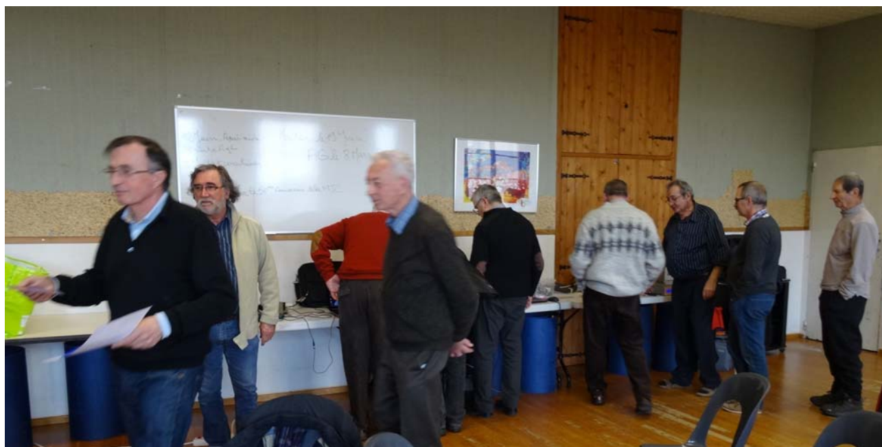
L'après-midi tout le monde est autour de la table des démonstrations techniques