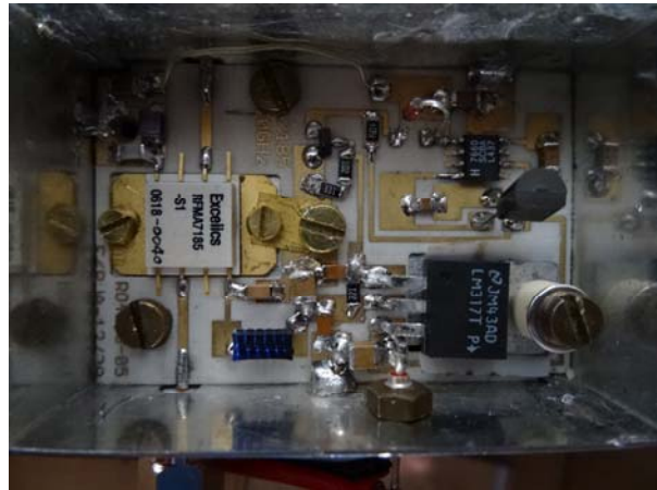
Détail du transverter 10 GHz (à gauche), et de son PA (à droite)