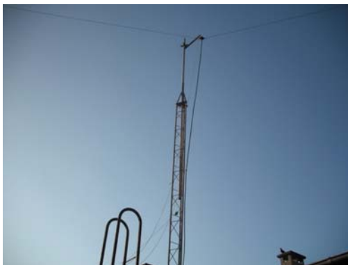
De haut en bas : le labo, les stations HF et V-UHF, les antennes verticales, le pylône.